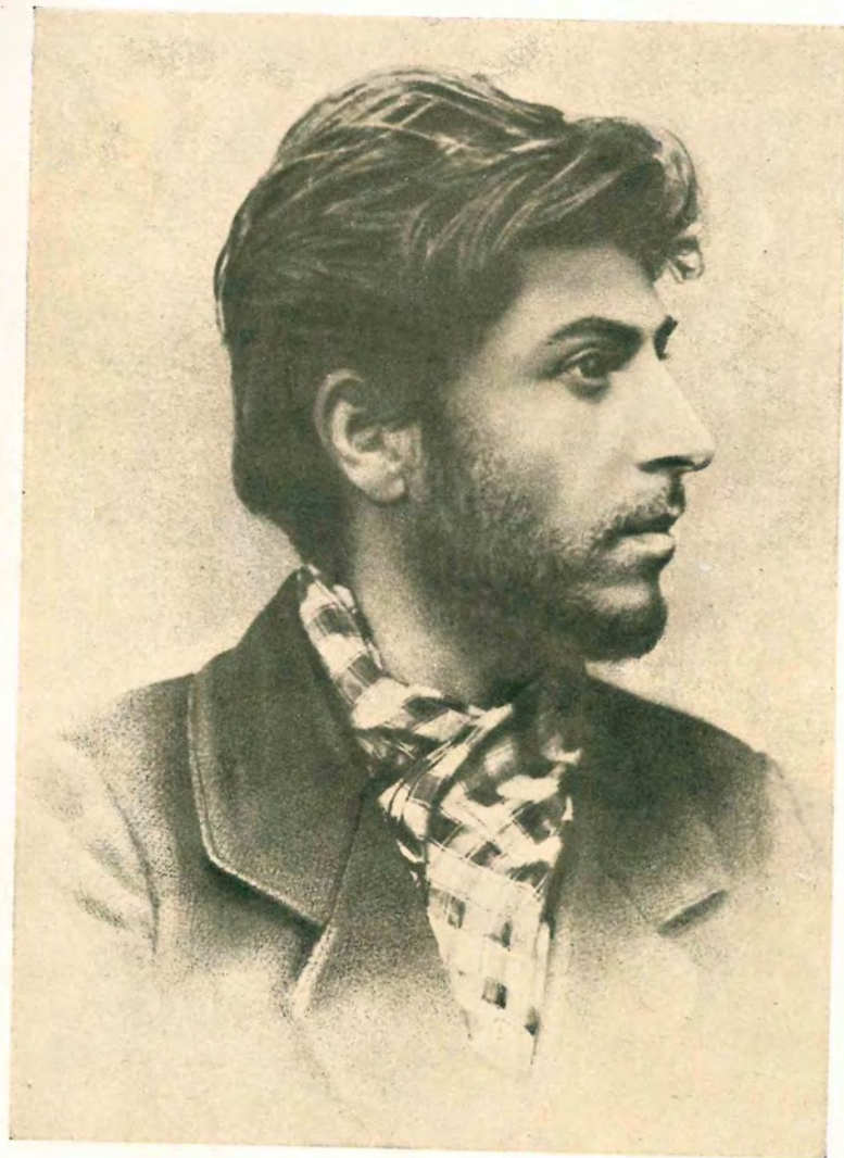
И. В. Сталин