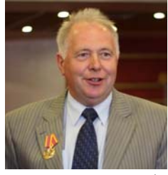
Почему надо спасать отечественный автопром? Потому что наш автопром, как и вся экономика, находится в конкурентной борьбе.

Иностранные конкуренты пытаются не поднять и развить его, а принизить и уничтожить. Это они делают очень удачно, например, в автомобильной промышленности. Так, в 1990 году наша страна выпускала около 1,5 миллиона легковых автомобилей и в 2010 году выпустила 1,5 миллиона автомобилей. Разница в том, что не стало АЗЛК, а ИЖМАШе упал выпуск в разы, «Ока» не выпускается ни на Серпуховском заводе, ни в Татарстане. «ЗИЛ» в разы сократил выпуск, а легковых не выпускает уже около 10 лет. Горьковский завод (владелец Дерипаска), зарегистрированный частью в офшорной зоне, прекратил выпуск «Волги» и пытался выпускать «Волгу-Сайбер» из комплектующих «Крайслера», привозимых из США. АвтоВАЗ собираются продать «Рено».